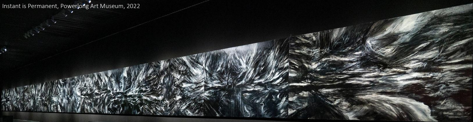
Instant is Permanent, Powerlong Art Museum, 2022